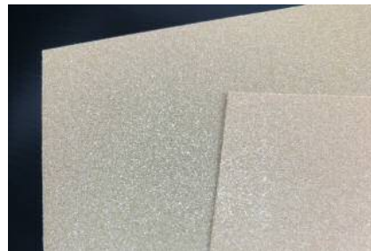
HT-340 0.5mm厚 (左: 64kg/m 3 、右: 128kg/m 3 )