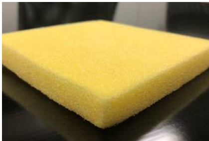
TA-301 10mm厚 (6.4kg/m 3 )