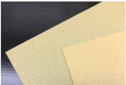
TA-301 0.5mm厚 (左: 64kg/m 3 、右: 128kg/m 3 )