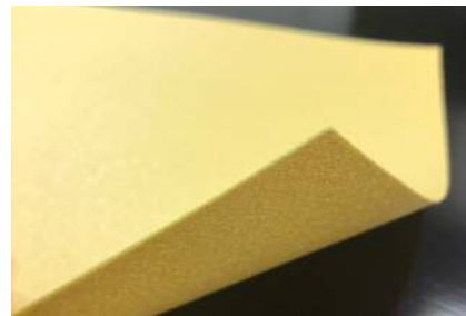
TA-301 0.5mm厚 (128kg/m 3 )